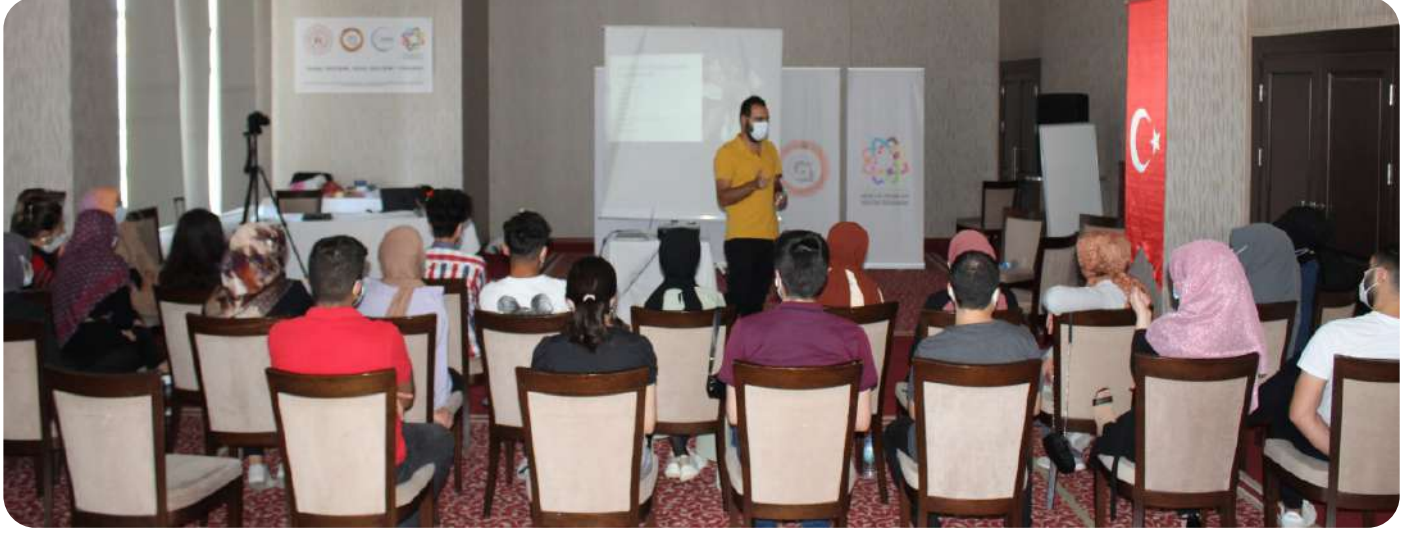
“Etkili Yazışma Teknikleri Eğitimi” 16 - 17 Ağustos 2021 tarihlerinde düzenlendi.

İki günlük eğitimde gençlere, iş yaşamında başarı için gerekli olan profesyonel iletişim becerileri üzerinde durulacaktır. Profesyonel hayatta iletişim; ilişki geliştirmek, insan davranışlarını değiştirmek ve verimli bir koordinasyon sağlamak amacıyla en önemli etkenlerdir. Profesyonel hayatta ihtiyaç duyulan etkili iletişim yöntemleri ve iletişim sanatının incelikleri bu eğitimde sunulmuştur.